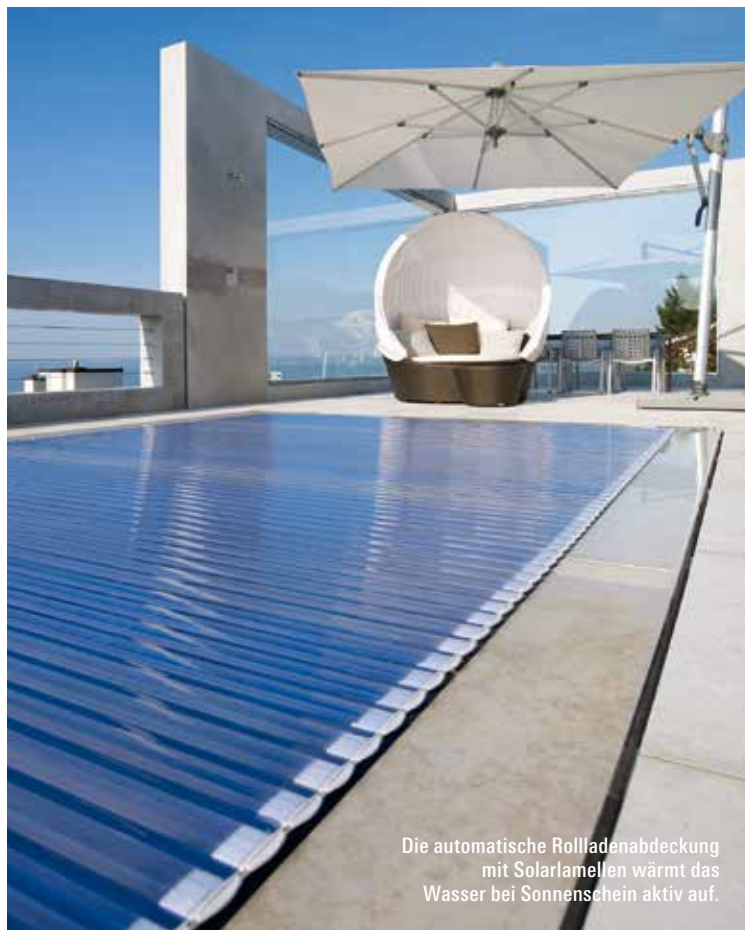
Die automatische Rollladenabdeckung mit Solarlamellen wärmt das Wasser bei Sonnenschein aktiv auf.

MARKUS ACHERMANN, AC SCHWIMMBADTECHNIK AG