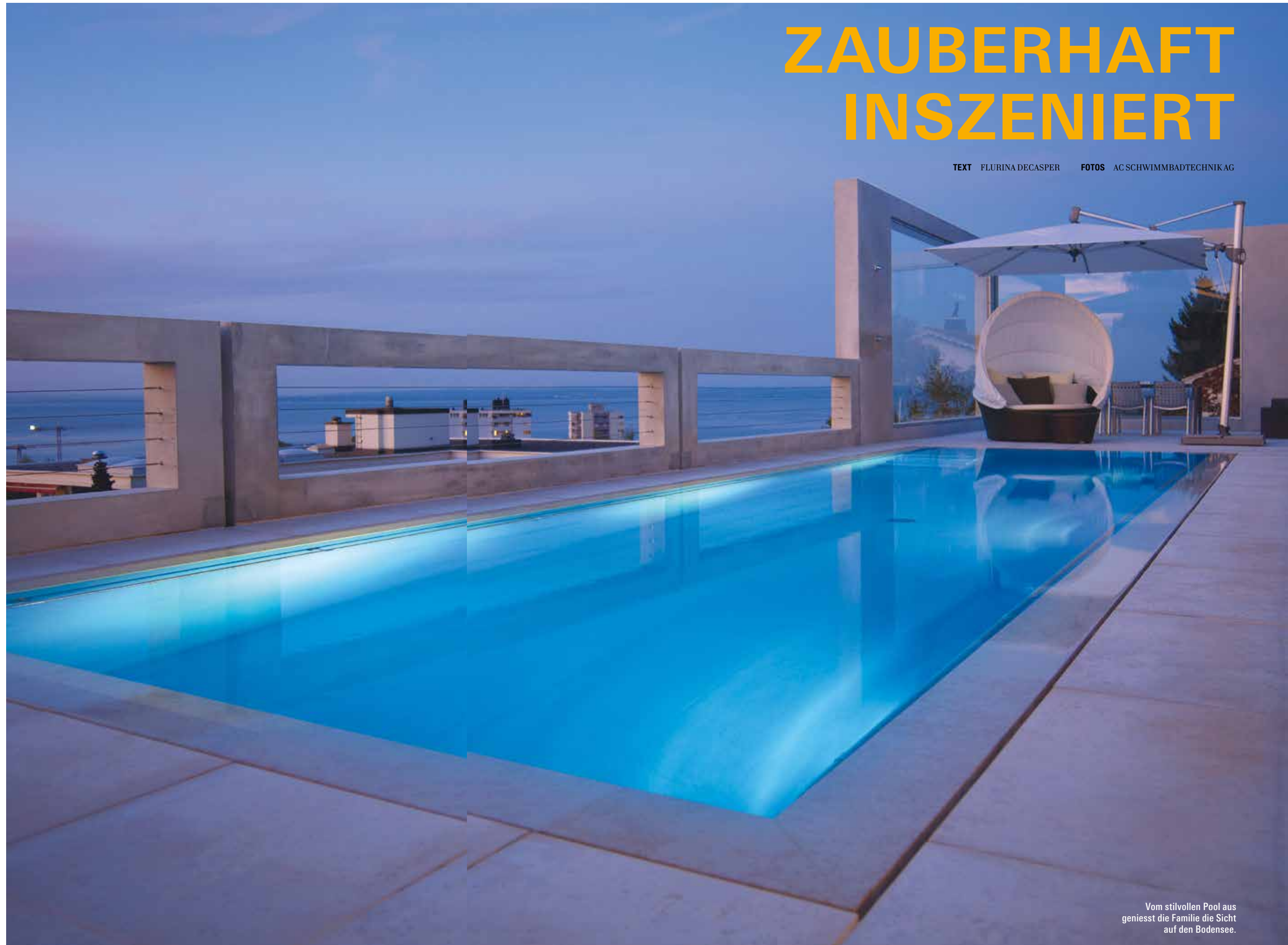
Vom stilvollen Pool aus geniesst die Familie die Sicht auf den Bodensee.

TEXT FLURINA DECASPER