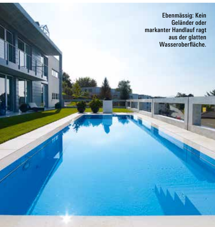
Ebenmässig: Kein Geländer oder markanter Handlauf ragt aus der glatten Wasseroberfläche.

L angsam, aber sicher naht er, der Sommer. Zwar lassen sich die diesjährigen T-Shirt-Tage noch an einer Hand abzählen. Doch wir wissen: Jetzt kann es schnell gehen, und ruckzuck lassen wir uns in Bikini oder Badehose die Sonne auf den Bauch scheinen. Am liebsten natürlich nur ein paar Schritte vom glitzernd-kühlen Nass entfernt, in dem man sich ab und zu erfrischen kann. Gerne auch mit schöner Aussicht. Und optimalerweise im privaten Rahmen. Während Strände und Seeufer im Sommer oft überbevölkert sind, bietet der eigene Garten einen ruhigen – und den wohl gemütlichsten – Aussenraum, um sich zu entspannen und zu sonnen. Und die modernen Möglichkeiten des Pool-Baus für den privaten Garten sind riesig – von der Form über die Konstruktion bis zum Oberflächenmaterial.